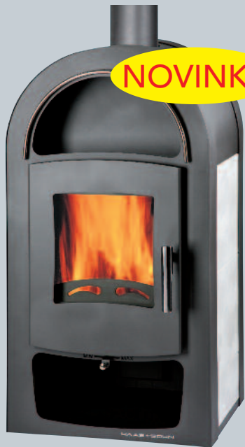
Grand Max Plus 11